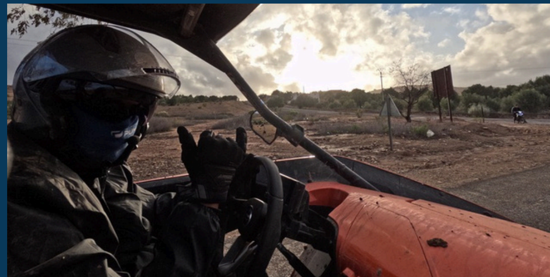
★★★★★ RAID NOVEMBRE 2025