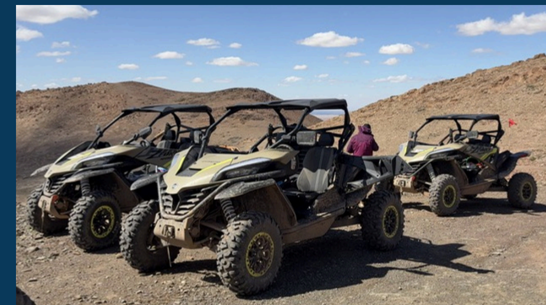
MÉCANICIEN DÉDIÉ ET 4X4 D'ASSISTANCE POUR TOUT LE RAID