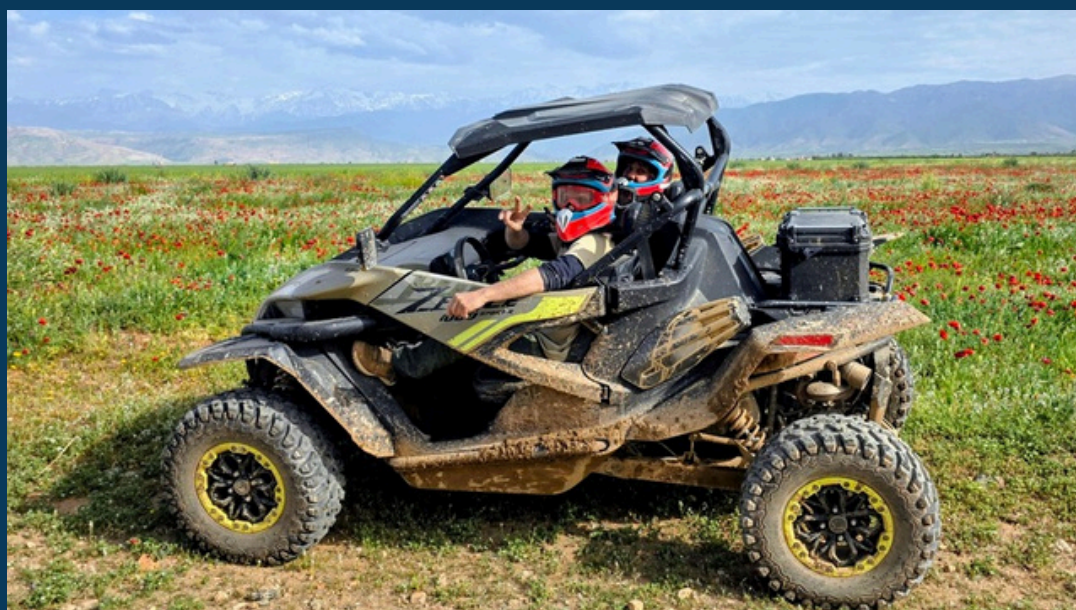
ROBUSTE & ADAPTÉ AUX MONTÉES ET PISTES CAILLOUTEUSES

Chaque véhicule est équipé pour accueillir un pilote, et un passager en toute sécurité.